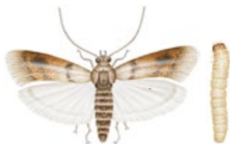
Fruktmott och mottlarv