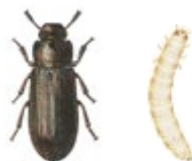
Mjölbagge och mjölbaggelarv